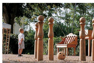
jeu quilles - Chanteloup