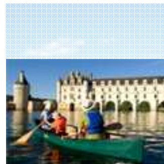
canoë - Chenonceau